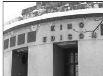
PO KINU SE GRAD POZNAJE Kinoklub Karlovac, Karlovac