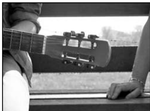
ELTON I ELZA › ELTON EN ELZA Making Movies Jekino, Belgija