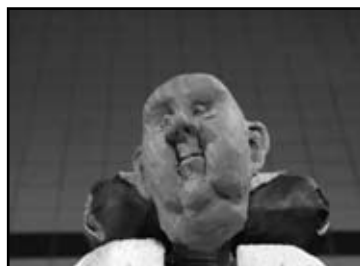
REZ › SNIT Making Movies Jekino, Belgija