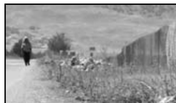
IZA ŠATORA › BEHIND THE TENTS Jude Chehab (samostalni autor), Libanon POSEBNO PRIZNANJE: DOM JE NEGDJE DRUGDJE › ZUHAUSE, WOANDERS Screenagers, Njemačka