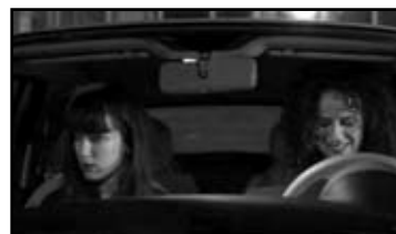
FREYA Station Next, Danska POSEBNO PRIZNANJE: KORISNIČKA PODRŠKA! › WIRED! Teds Beard! Productions, Irska