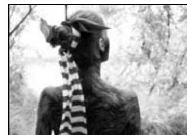
MLAD KOLIKO I JUČER › JAUNA VAKARDIENA Electric December Watershed, Ujedinjeno Kraljevstvo i Latvija