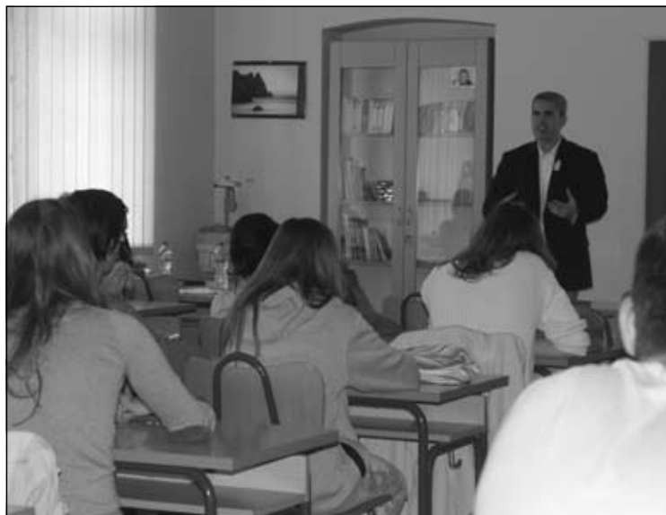
ISPRED PUNOG RAZREDA. Predavanje u karlovačkoj Gimnaziji.

N e bojte se starih filmova, prihvatite ih, zaljubite se u njih i zavolite ih jer oni vam će vam omogućiti da budete bolji redatelj – glavna je poruka vrlo zanimljivog predavanja koje je održao David Whitt, član ocjenjivačkog suda karlovačkog Festivala koji je do našeg grada potegnuo čak iz SAD-a. I sva sreća da jest, jer je pripremio uistinu iscrpno predavanje o povijesti filma krenuvši od najranijih početaka pa sve do danas. Osvrnulo se na sve ključne trenutke koji su obilježili moderno filmsko stvaralaštvo, a koji svoje korijene nalaze u ostvarenjima za koje nikada ne bismo pretpostavili da su ostavili toliko utisak na modernu kinematografiju, a nastala su sredinom prošlog stoljeća. Da je predavanje bilo edukativno i zanimljivo dokazuje i prepuna učionica povijesti, inače kapacitetom najveća u Gimnaziji Karlovac, u kojoj već dugo ovako velik broj ljudi nije sjedio koncentrirano u vertikalnom položaju punih četrdeset i pet minuta. Iako isprva pomalo sramežljivo, nakon završetka predavanja gosti su bili raspoloženi za diskusiju i postavljanje