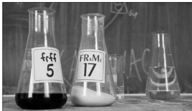
“MIJEŠATI VALJA VRLO LAGANO”. Filmska revija mladeži (FRaMe) i Four River Film Festival (frff) pokazali su eksplozivnu kemijsku reakciju.

elemenata, pa ako vam se omakne – “kak’ je ovo dobar film bio ... a tek tulum!”, ne brinite, to je samo jedna od bezopasnih nuspojava. Ako vam se uz to čini da svijet ovih par dana promatrate kroz žute naočale, čestitamo, postali ste dio uspješnog kemijskog filmskog eksperimenta. (sv)