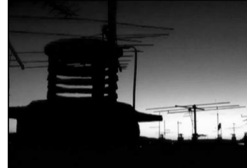
KOJIH NIJE BILO Kino klub Split, Split