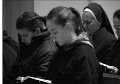
CRNO-BIJELI SVIJET? Novinarska družina Isusovačke klasične gimnazije, Osijek