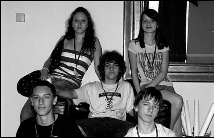
Studio kreativnih ideja Gunja

Kino klub broji dvadesetak članova, a ovdje nas je četiri. Ovo je naš prvi film i ujedno prvi koji smo poslale u Karlovac. Čini nam se da je naš film najbolji u konkurenciji eksperimentalnih filmova. Teme dokumentarnih filmova su ozbiljnije, a karlovački filmovi imaju dosta nasilja.