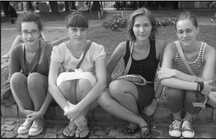
Kino klub Split

Post Scriptum je bio malo pretežak, najbolji se činio Crno-bijeli svijet. Odlično smo se proveli. Jako nam je lijepo ovdje, društvo je super. Nismo gladni, to je najbitnije! Ne znamo što očekivati, konkurencija je žestoka u dokumentarnom filmu, ostalo nas je razočaralo.