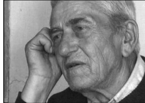
A DI SI TI MENI Studio kreativnih ideja Gunja, Gunja