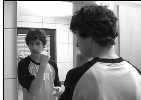
PA NE ŽE SPET / UVIJEK ISTO Luksuz produkcija, Krško (Slovenija)