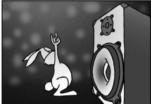
ENTER ŠAF, Vranje (Srbija)