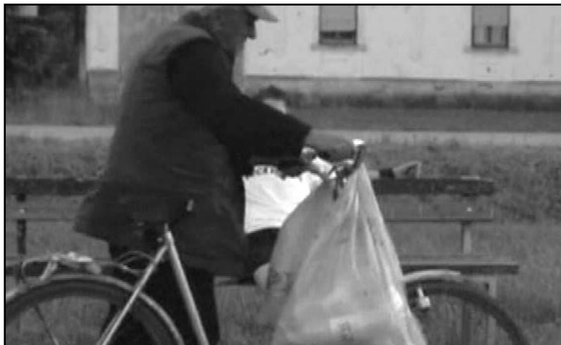
Studio kreativnih ideja Gunja, Gunja

Žiri je imao težak zadatak! Filmovi su ove godine bitno napredovali u ozbiljnosti i ambicioznosti te su bili ujednačene kvalitete. Nakon dugog viječanja, izabrali su najbolje radove. Nagrada za Grand Prix je skener, filmovi koji su osvojili najviše srca publike osvajaju DVD-player, a svi nagrađeni dobit će knjigu "Animacija i realizacija", te poklon paket Revije. Čestitamo.