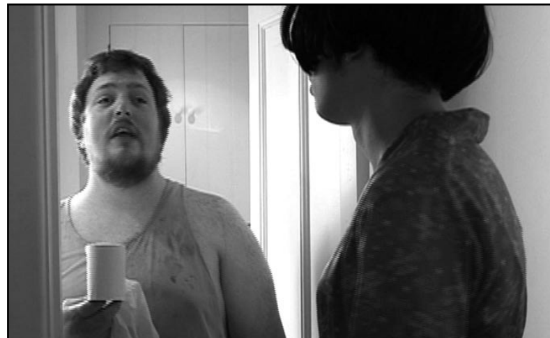
Suited and Booted Studios, Bristol (Ujedinjeno Kraljevstvo)

Nagrada publike: KILL THE SLOB / UBI ĐUBRE!