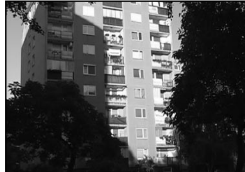
VSI SMO IZ BRONXA / SVI SMO IZ BRONXA Luksuz Produkcija, Krško (Slovenija)